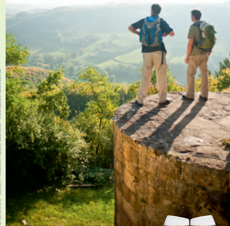
Layout / Produktion: Kaisers Ideenreich · www.kaisers-ideenreich.de